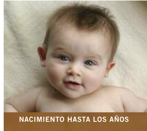
NACIMIENTO HASTA LOS AÑOS

El Sistema de Intervención Temprana de New Jersey o en inglés New Jersey Early Intervention System (NJEIS) bajo el Departamento de Salud implementa el sistema estatal de New Jersey de servicios para los niños desde el nacimiento hasta la edad de 3 años, con retrasos del desarrollo o discapacidades y a sus familias. Los programas estatales de intervención temprana son gobernados por la Parte C de la Ley de Educación para Personas con Discapacidades o en inglés, Individuals with Disabilities Education Act (IDEA).